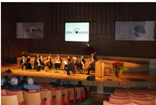
„KOPEX” świętował tradycyjną Barbórkę w pięknej sali Akademii Muzycznej w Katowicach

Od mszy świętej w intencji górników i pracowników KOPEX – Przedsiębiorstwa Budowy Szybów rozpoczęły się 3 grudnia 2008 roku uroczystości barbórkowe w naszej bytomskiej firmie. Załoga spółki uczestniczyła następnie w akademii zorganizowanej w Ośrodku Szkoleniowo-Rekreacyjnym „Silesiana” w Kokotku. W trakcie spotkania jubilatów i wyróżniającym się pracownikom przedsiębiorstwa wręczone zostały odznaki „Zasłużony dla górnictwa”, szpady górnicze oraz pamiątkowe zegarki. Nadane zostały także stopnie górnicze: górnika III stopnia oraz inżyniera górniczego III stopnia.